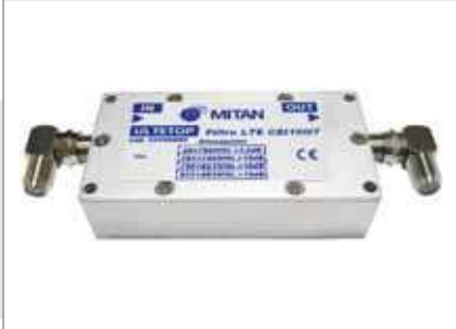
ULTETOP - Filtro a norma CEI